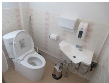
小学校給食調理室の トイレ洋式化・手洗い設備設置