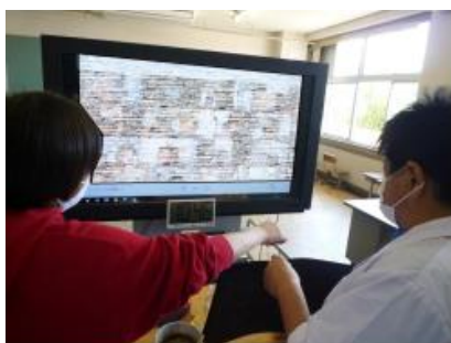
【石川小】双方向型オンライン授業