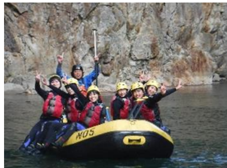
鬼怒川でのラフティング体験