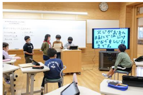
大型提示装置を活用した授業

全ての普通教室に1台ずつ、大型提示装置（モニター）を設置し、協働的な学びや豊かな表現力の育成を図るとともに、オンラインでの授業やコミュニケーション能力の育成などに活用する。