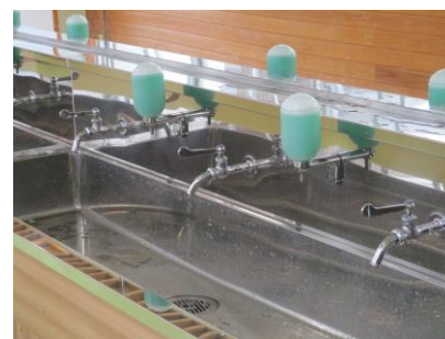
レバーハンドルの設置