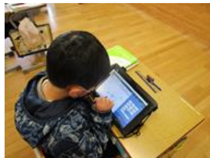
AIドリルを活用した個別学習