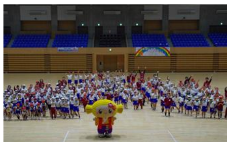
新荘オリンピック2020（アダストリア みた アリーナ）