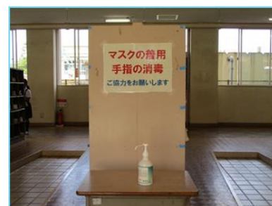
手指消毒液の設置