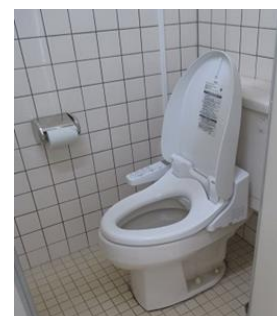
校舎トイレの洋式化