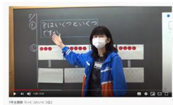
【下大野小】授業動画の配信