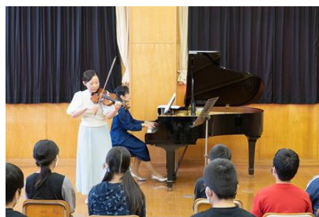
水戸室内管弦楽団による 小学校での訪問コンサート

「リリーアリーナMITO」での開催を変更し、水戸室内管弦楽団が小学校を訪問し、学校で演奏する「訪問コンサート」を実施した(10月～12月開催)。