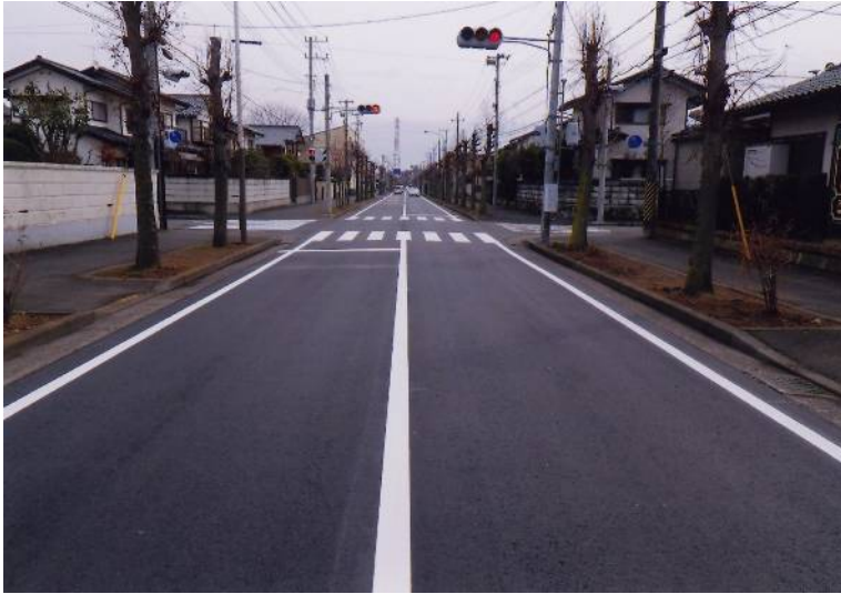
幹線市道38号線舗装補修工事