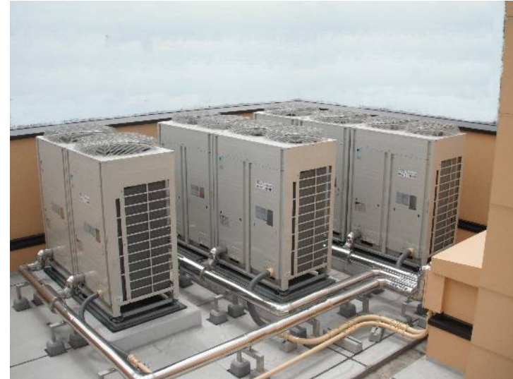
老人福祉センター八幡荘移転改築機械設備(空調)工事