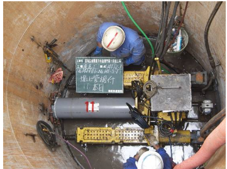
国補流域関連下水道酒門第1幹線工事