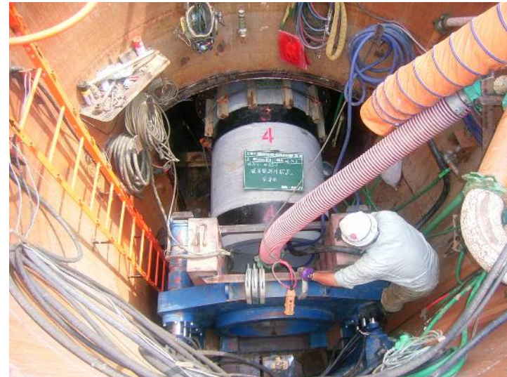
国補公共下水道桜川上流右岸第5排水区枝線(1工区)工事