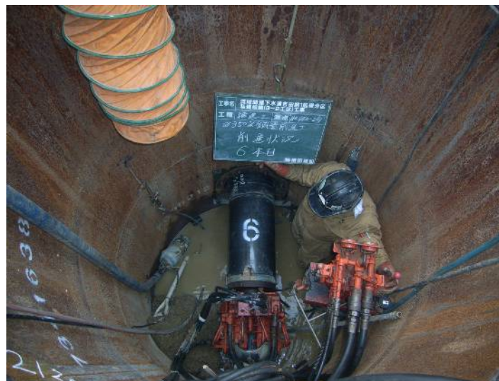
流域関連下水道吉田第1処理分区私道枝線(3-2工区)工事