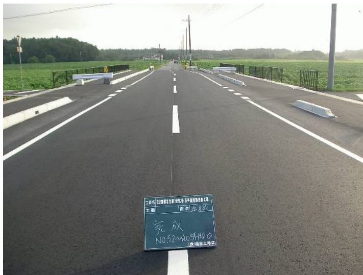
22国補活計第1号筑地・五平線道路改良工事