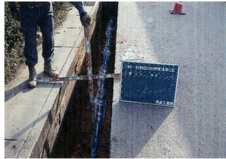
配水管布設及び給水管切替工事(第67工区)