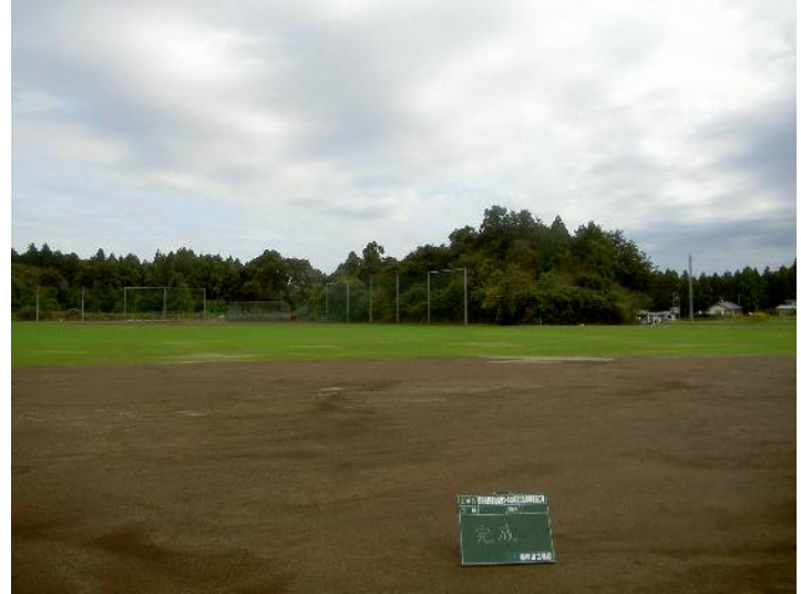
田野市民運動場第5・6球場及び駐車場復旧工事