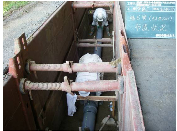
国補第12号単市第9号農集建設下大野上大野地区 管路施設(第22-10工区)工事