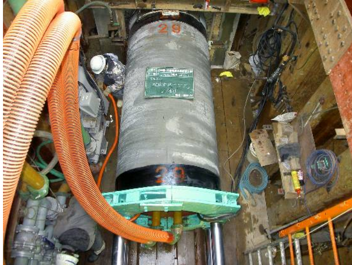
上中妻・大塚町排水路新設工事