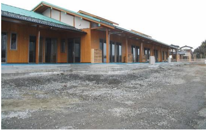
河和田保育所移転増改築工事