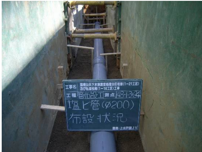
国補公共下水道渡里処理分区枝線(1-21工区) 及び私道枝線(1-16工区)工事