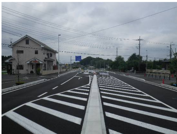
国補まち交赤道都市計画道路3・3・30号線(堀1工区)道路改築(その2)及び国補公共下水道渡里処理分区枝線(1-19工区)工事