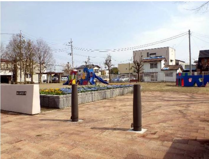
国補裡1丁目児童公園整備工事