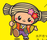
水戸市マスコットキャラクター みとちゃん