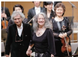
2017年水戸室内管弦楽団第99回定期演奏会より