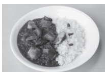
根菜たっぷり冬カレー

園内の喫茶フィオレンテでは、「冬めぐり薬膳」の提供をしています。 期間/2月24日(日)までの土・日曜日 料金/1,200円(税込) メニュー/根菜たっぷり冬カレー、赤ワインみそソースのハンバーグ(1日各30食限定) ※ハーブサラダ、ハーブティー、デザート付き。