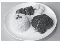
赤ワインみそソースのハンバーグ