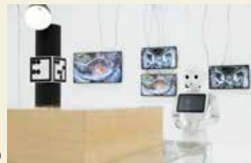
展示風景

参加作家 デヴィッド・ブランディ、小林健太、サイモン・デニー、セシル・B・エヴァンス、エキソニモ、レイチェル・マククリーン、ヒト・シュタイエル、谷口 暁彦