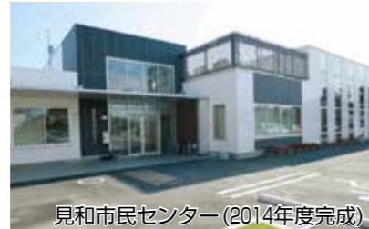
見和市民センター(2014年度完成)