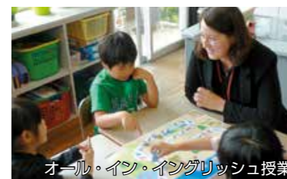
オール・イン・イングリッシュ授業