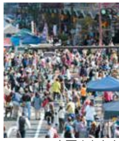
水戸まちなかフェスティバル