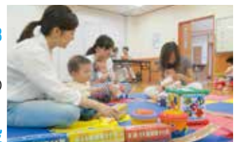
市民センター子育て広場