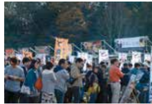
水戸のラーメンまつり