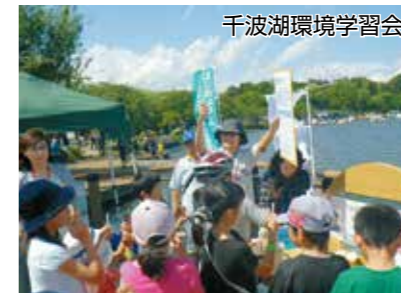
千波湖環境学習会