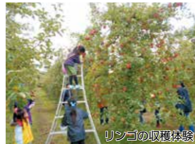
リンゴの収穫体験