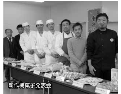
新作梅菓子発表会