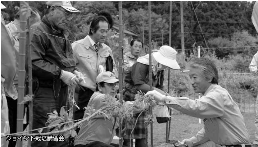
ジョイント栽培講習会