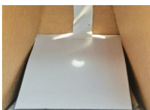
ピンホールを使って撮影した部分月食(2019年1月)

一番おすすめの観察方法は「ピンホール」です。名刺やはがきなど、光を通さない厚紙または薄い板に小さな穴を開けます。この小さな穴を通った太陽の光を、地面や白い紙などに映して観察するのです。周りから光が入らないように囲いを作ればさらに観察しやすくなるでしょう。この方法では、直接太陽の方向を見ることはないで、目を痛める心配が全くありません。さらに、簡単な方法ながら、簡単に記録写真を撮れるという利点もあります。見た目の太陽の大きさは実は意外