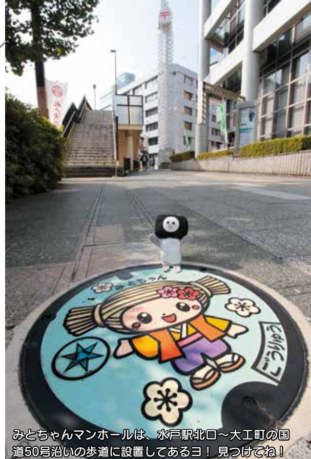
みとちゃんマンホールは、水戸駅北口～大工町の国 道50号沿いの歩道に設置してあるヨ！ 見つけてね！