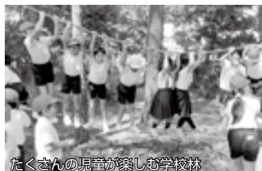
たくさんの児童が楽しむ学校林