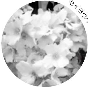
セイヨウバイカウツギ