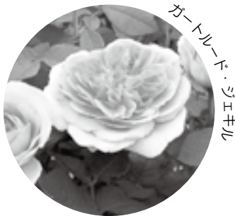
ガートルード・ジェキル