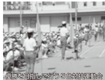
優勝を目指して行う5色対抗運動会

緑岡小学校は、1000人を超える児童が通う、市内で一番児童数の多い小学校です。中休みや昼休みの時間になると、運動場が児童の笑顔と大きな声で一杯になります。下級生と上級生と一緒に遊ぶ「ふれあいタイム」も楽しいです。