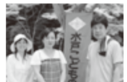
親子をやさしく見守る水戸こどもの劇場の皆さん