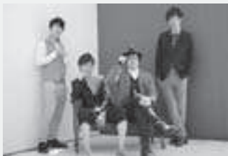
Mary days story(バンド)