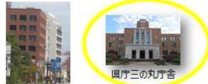
レガ風建築の外観が、具三の丸庁舎と調和しています。