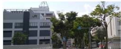
白～グレーの色彩や落ち着いた外観が、白壁等のまちなみと調和しています。

○歴史的なまちなみの近くでは、類似した形態・意匠を取り入れると、より調和を図りやすくなります。