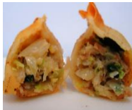
みとちゃん餃子 (水戸市産ねぎ・ キャベツ・にら・ 米粉・豚肉)