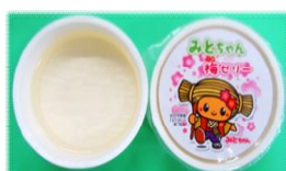
みとちゃん梅ゼリー (水戸の梅ふくゆい)