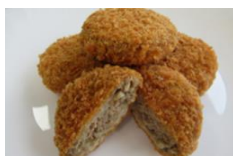
みとちゃんごぼう メンチカツ (水戸市産ごぼう)