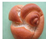
みとちゃん米パン (水戸市産米粉)