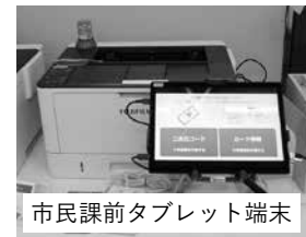
市民課前タブレット端末