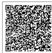
（お申込み用 QR コード）

水戸市教育委員会 みと好文カレッジ 〒310-0852 水戸市笠原町 978-5 総合教育研究所 3F TEL 029-303-6602 FAX 029-303-6601 Mail koubun@pluto.plala.or.jp